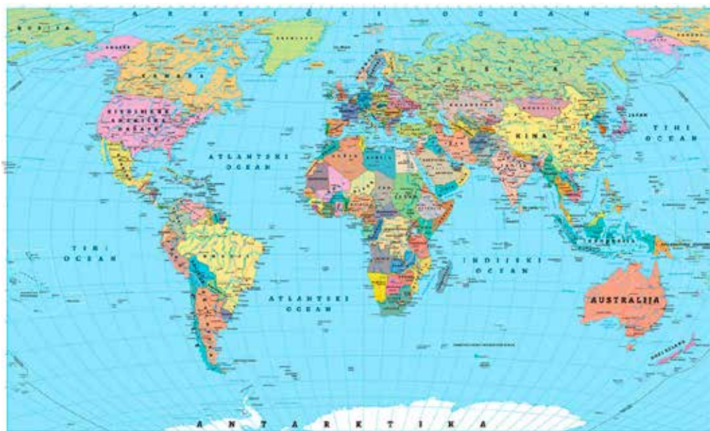
Politička karta svijeta 51

Evropa i Azija nisu 2, već jedan - kontinent Evroazija.